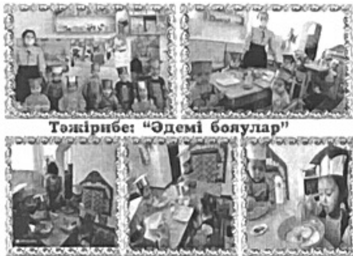
Тәжірибе: "Әдемі болулар"